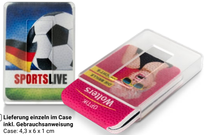
C1 Lieferung einzeln im Case inkl. Gebrauchsanweisung Case: 4,3 x 6 x 1 cm

Lieferbar ab Februar 2018 | 🚚 Express-Service 3 möglich!