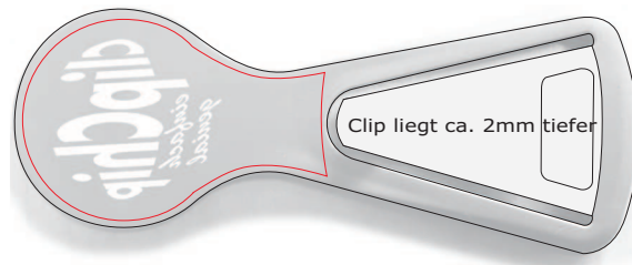
Rückseite, max. 24mm x 36mm