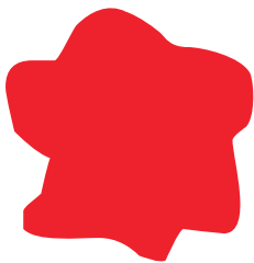
05 | Rot