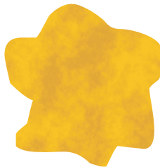
10 | Gold

Metallfarbenzuschlag | 15,00 EUR / Pauschal