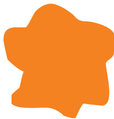
06 | Orange