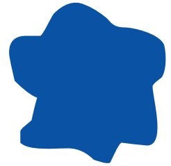
04 | Königsblau