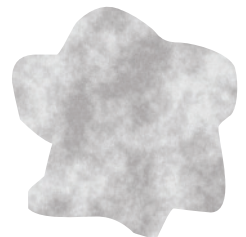
11 | Silber