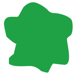
08 | Grün