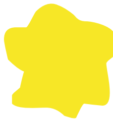
07 | Gelb